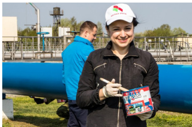
На субботнике - молодежь «Брестводоканала».

От коллектива мусороперерабатывающего завода в субботнике участвовали 368 человек. Убрали прилегающую территорию, работали на Ковельской и Фортенной, высадили туи на участке приемки крупногабаритных отходов. В этот день традиционно был облагорожен памятник на месте захоронения генерал-майора князя Павла Давидовича Пхейдзе, скончавшегося от раны, полученной в сражении 14 апреля 1831 года.